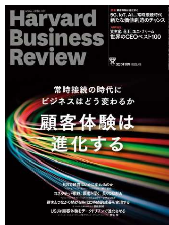
2020年1月号 「顧客体験は進化する」