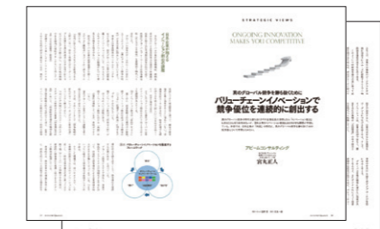
広告タイアップ (イメージ)

※広告タイアップの誌面内に「制作/ダイヤモンド社クロスメディア事業局」という制作クレジットとスポンサー企業様の「問い合わせ先」が入ります。