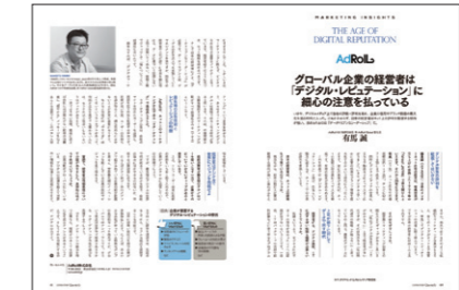
編集コラボレーション記事 (イメージ) ※デザイン、レイアウトは変更になる場合があります。

特集のテーマに関わらず、自由なテーマで編集コラボレーション記事を掲載することができます。