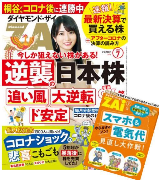
『ダイヤモンドZAI』売上(前年同期比)