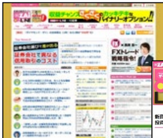
●タイアップ記事一覧